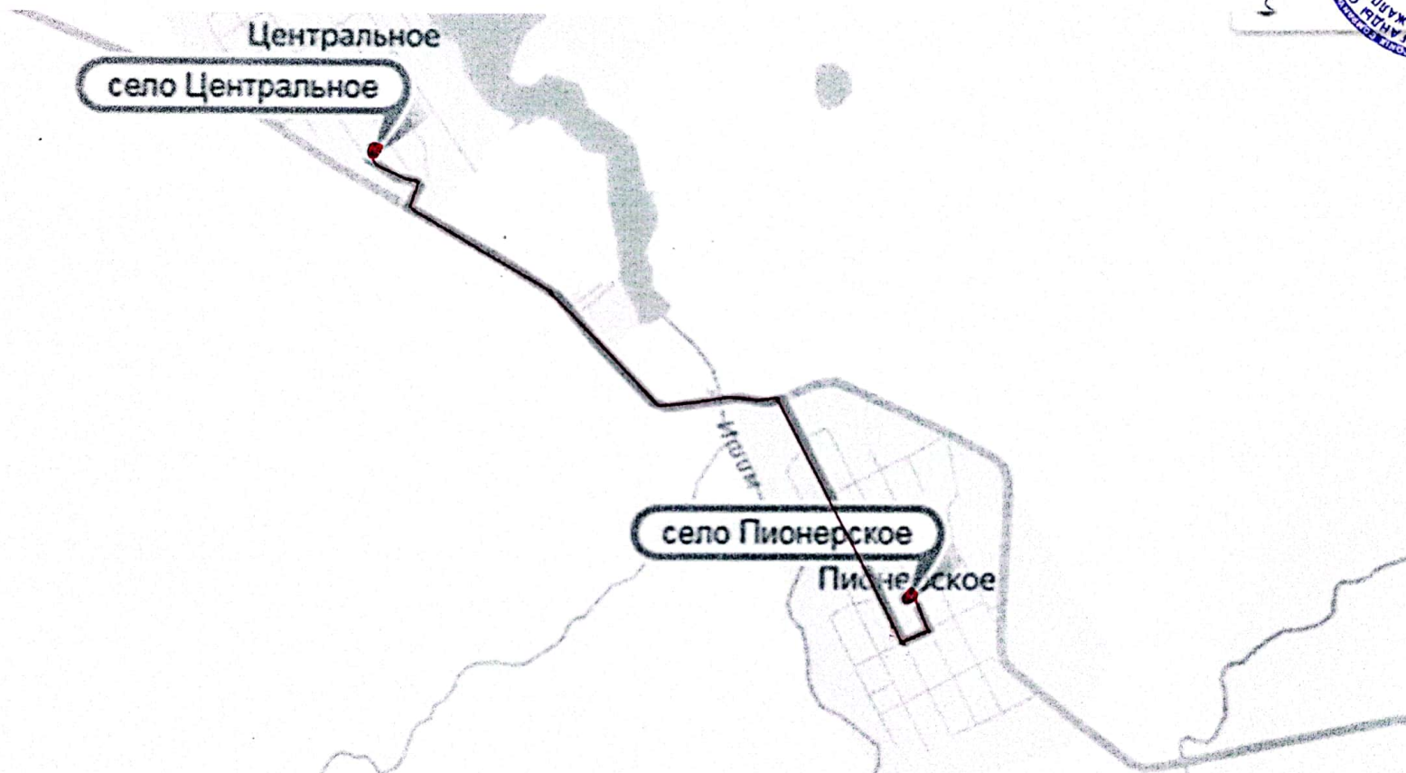
Схема маршрута подвоза учащихся села Центральное