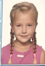
фото 1-4 сынып 1-4 класс фото 1-4 сынып 1-4 класс

9 Оқушының сыныптан сыныпқа көшірілуі мен ауыстырылуы Переводы из класса в класс и перемещения ученика(цы) в течение учебных лет