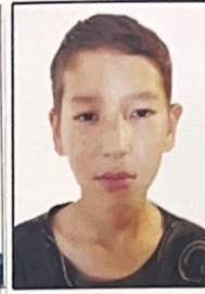
Фото 10-11(12) сынып 10-11(12) класс

Әкесінің аты (болған жағдайда) Отчество (при наличии) | Денисович