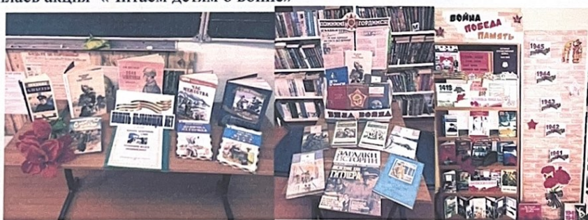
«Страницы Отечественной истории по художественным произведениям»