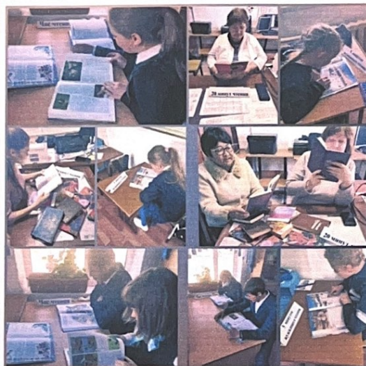
Проводилась акция «Читаем детям о войне»