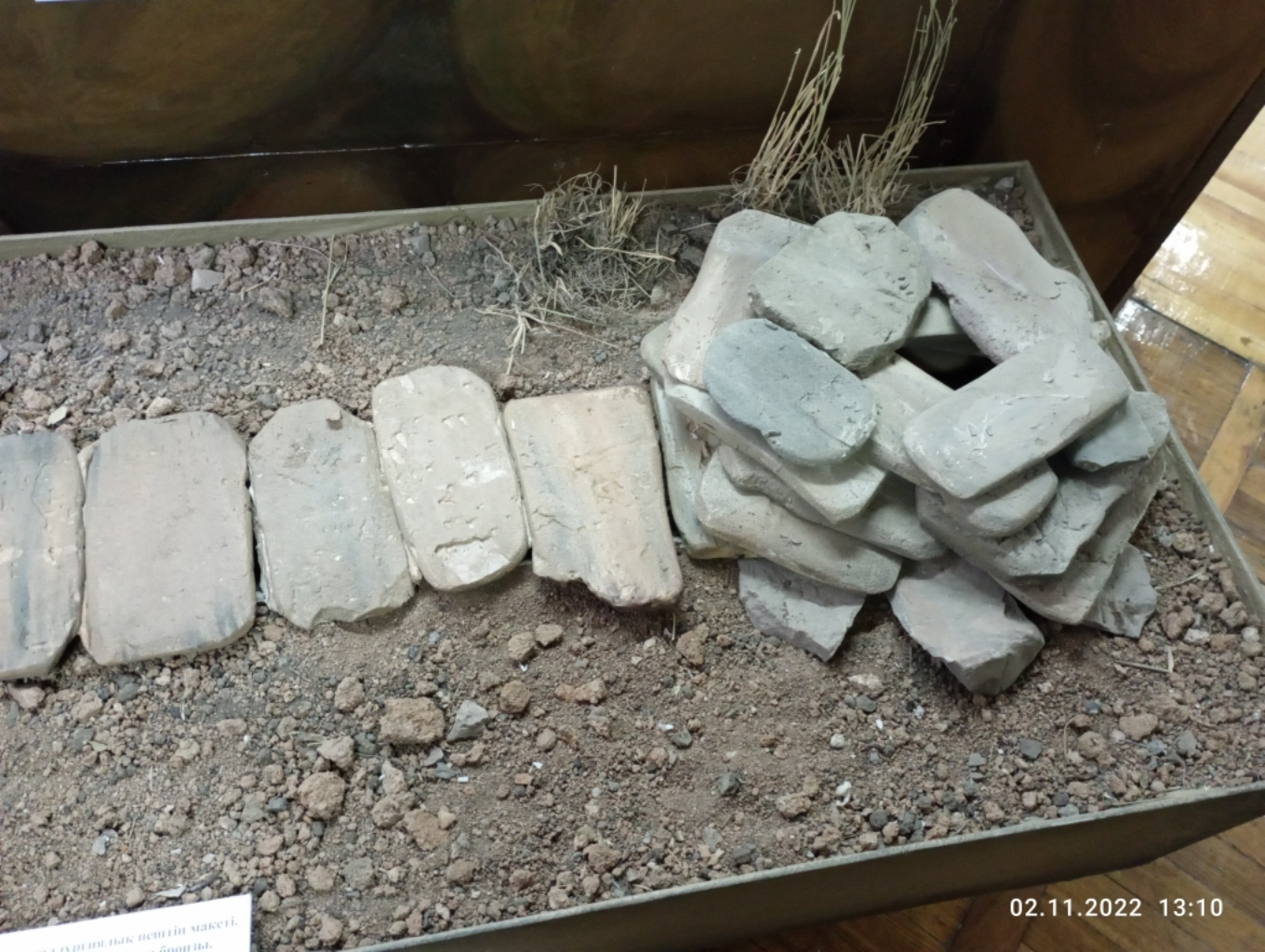
Бұл құрлымының негізгі мақсәті ... болды.