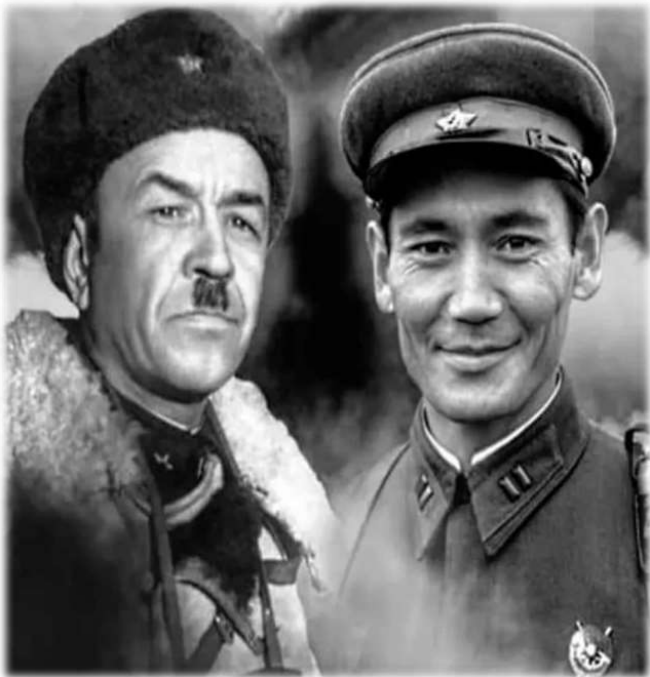
БАУЫРЖАН МОМЫШҰЛЫ - АТЫ АҢЫЗҒА АЙНАЛҒАН БАТЫР - ПАНФИЛОВШЫ