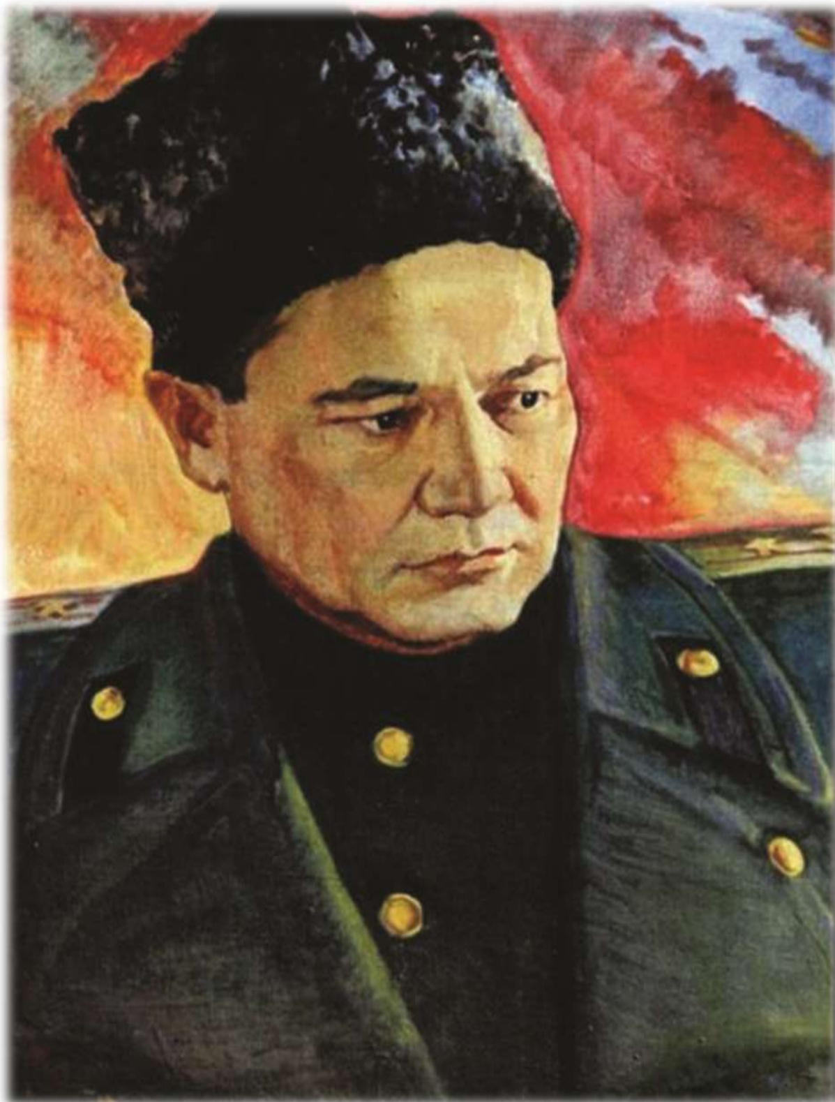
БАУЫРЖАН МОМЫШҰЛЫ — ҚАЗАҚ ХАЛҚЫНЫҢ АҢЫЗЫ