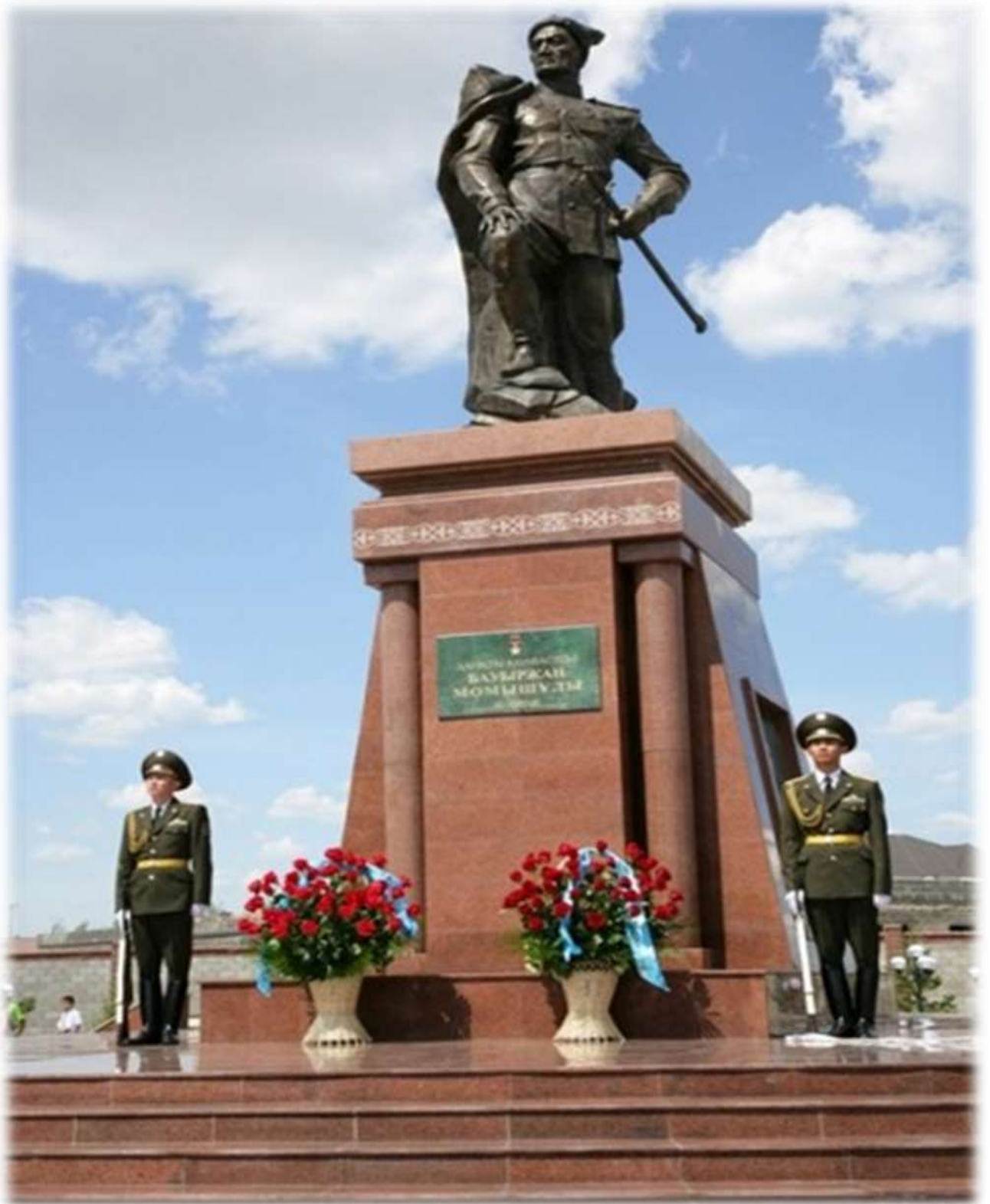
БАУЫРЖАН МОМЫШУЛЫ – ЛЕГЕНДА КАЗАХСКОГО НАРОДА