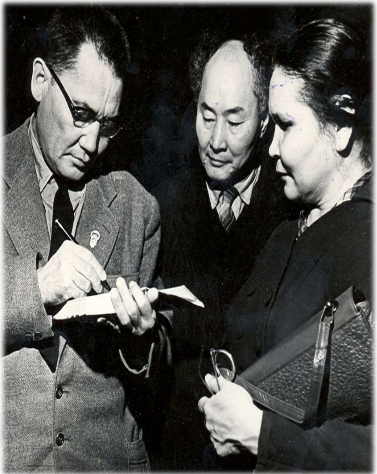
БАУЫРЖАН МОМЫШҰЛЫ - ҚАЗАҚ ХАЛҚЫНЫҢ БЕЛГІЛІ ЖАЗУШЫСЫ